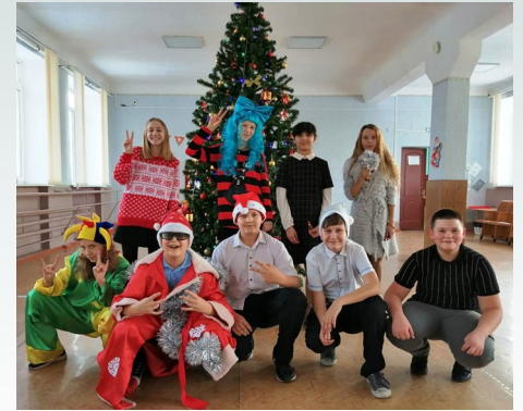
В 6б классе современный Дед Мороз и его Администратор встретились и соревновались с устаревшими персонажами: Мальвиной и Шутом